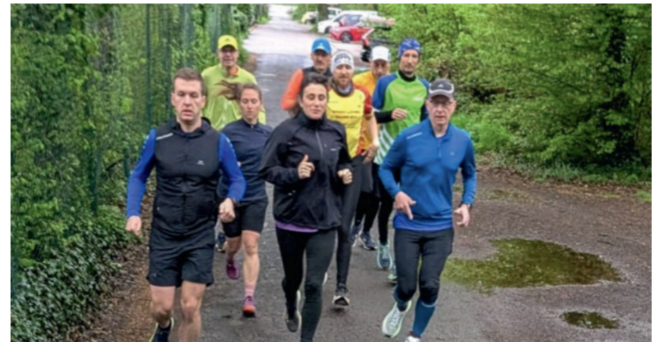
Bilder vom Sunday is Runday