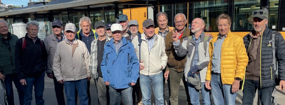
Treffpunkt am HBF Karlsruhe

nach Geroldsau war zwar pünktlich, die Fahrt, aufgrund baulicher Maßnahmen und damit bedingter kurvenreicher Umleitungen, dauerte gefühlt jedoch eine Ewigkeit. Die kleine Wanderung zur Geroldsauer Mühle startete an der Haltestelle „Schule Geroldsau“. Stete Steigung auf gut zu laufendem Untergrund war für alle Wanderlustigen, auch die etwas eingeschränkten Läufer, gut zu bewältigen, ebenso der folgende Abwärtsweg. Nur die letzten Höhenmeter zur Gaststätte wurden auf abschüssigem schlechtem Serpentina-Pfad für unsere