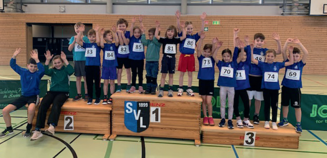
Gruppenbild aller teilnehmenden Kinder