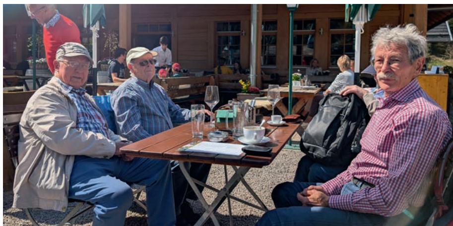
Im Gastgarten der Geroldauer Mühle

Die Rückfahrt mit dem Bus nach Baden-Baden lief zwar nicht ganz glatt ab, aber ist nicht weiter zu vertiefen, da wir