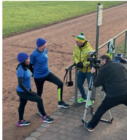
Filmdreh für die SWR Landesschau