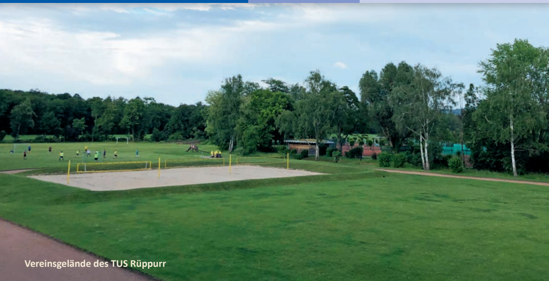
Vereinsgelände des TUS Rüppurr